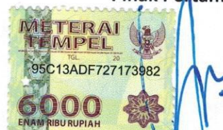
YUNITA FITRI, SE